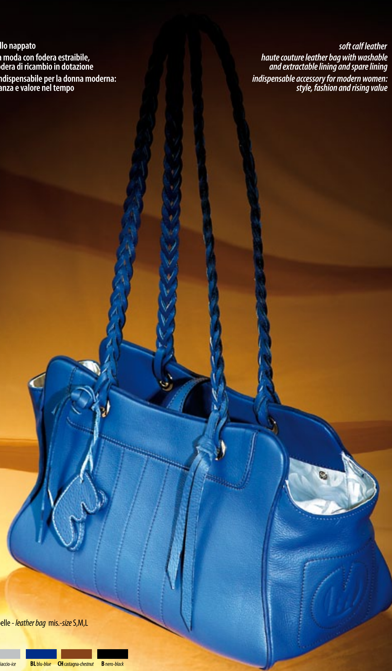
M15.26 borsa pelle - leather bag mis.-size S,M,L