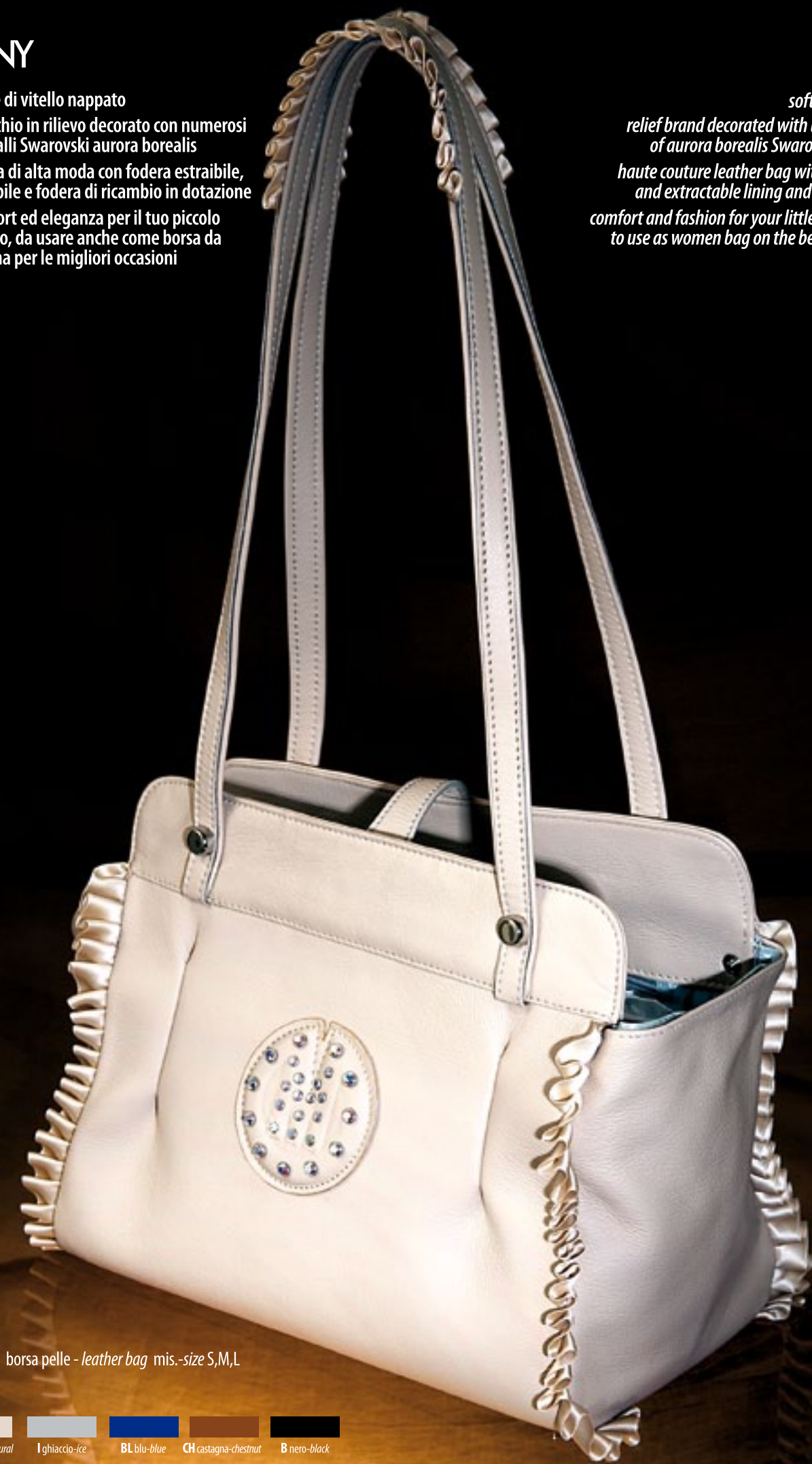
M15.25 borsa pelle - leather bag mis.-size S,M,L