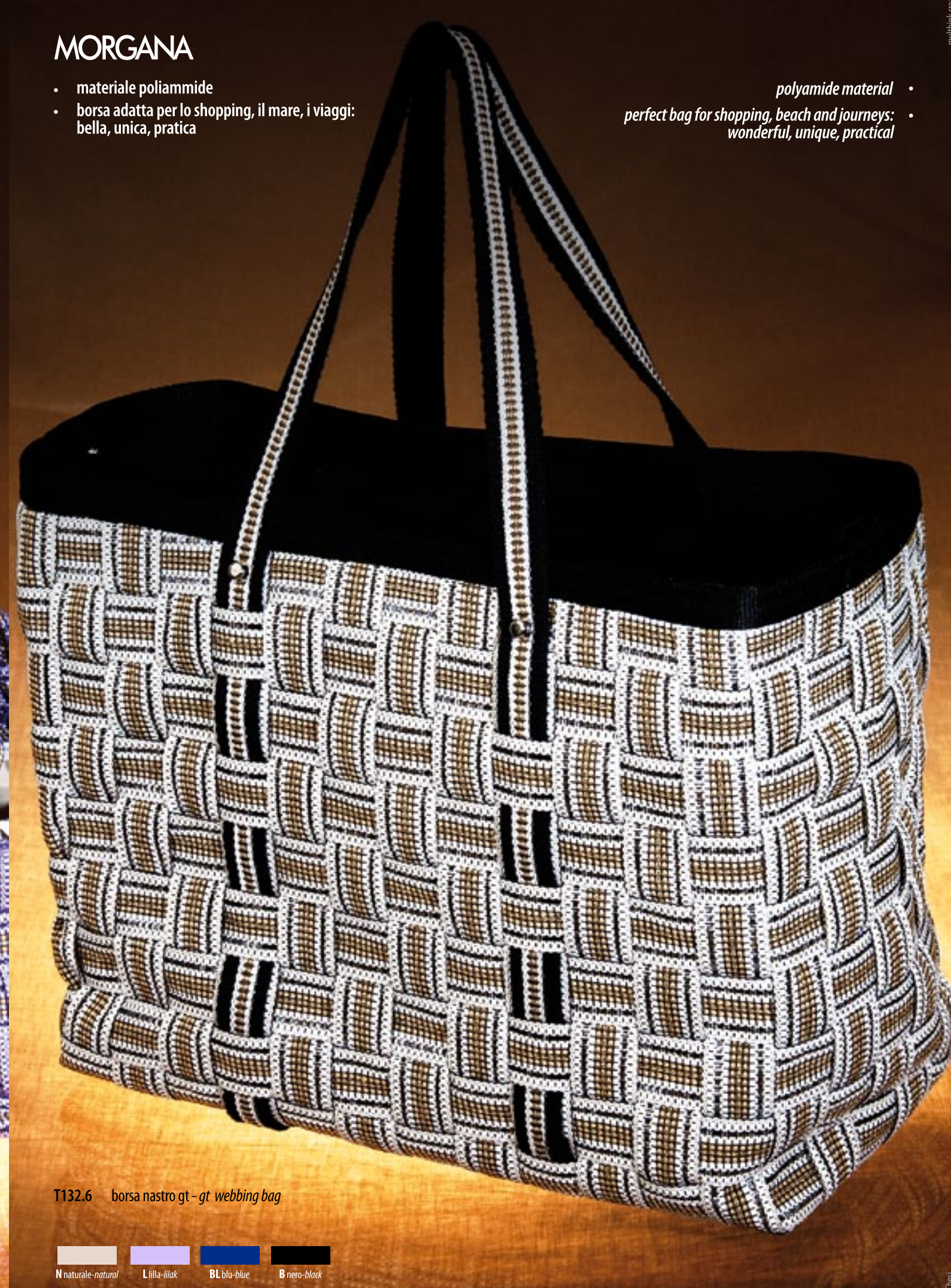
T132.6 borsa nastro gt - gt webbing bag