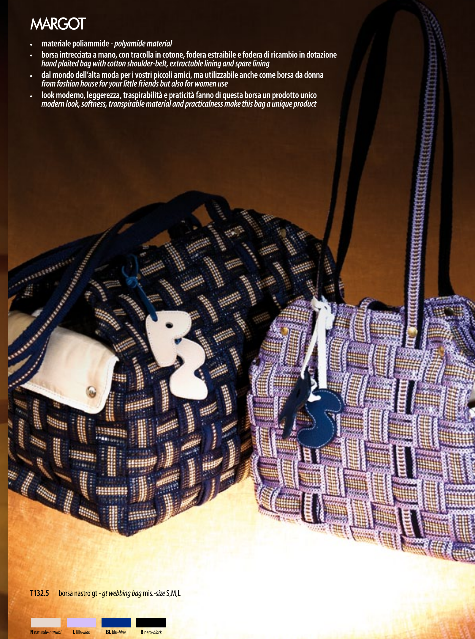
T132.5 borsa nastro gt - gt webbing bag mis.-size S,M,L