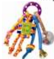
562 Activity Ring