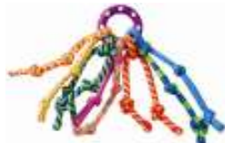
563. Knotty Fun