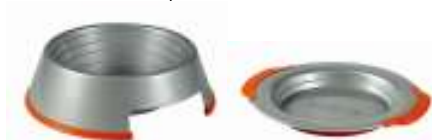
002. Healthy Portion Cat Feeding Combo