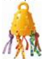
561 Dome Pull

Siendo animales muy sociales, los pájaros necesitan tener actividades interesantes y variadas a su disposición para asegurarles una existencia feliz. Por esta razón deben tener juguetes que desafíen sus capacidades y les ayuden a reducir el aburrimiento, factores que le pueden llevar a tener comportamientos menos apropiados. Petstages® ha desarrollado los significativos Playing Toys destinados a los amigos de las aves.